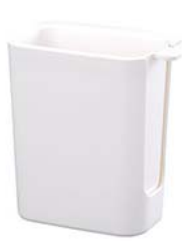
シンクの ゴミポケット