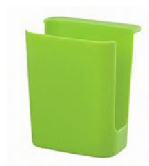
シンクの スポンジポケット