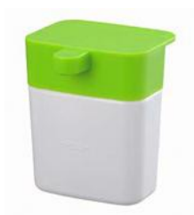
シンクの ディスペンサー