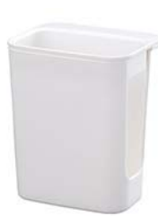
シンクの ツールポケット